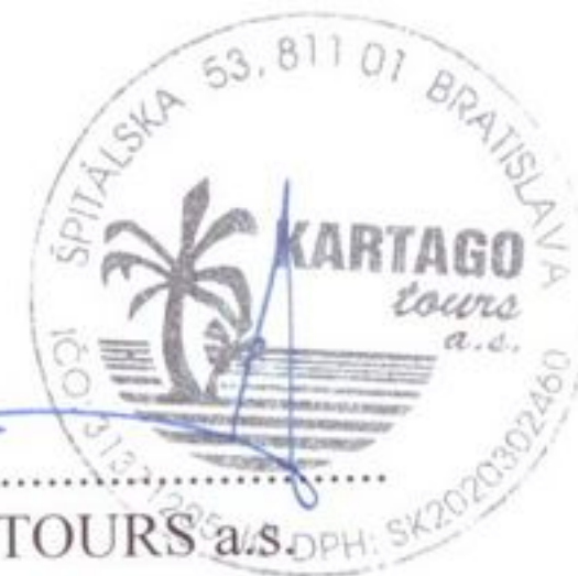
KARTAGO TOURS a.s.